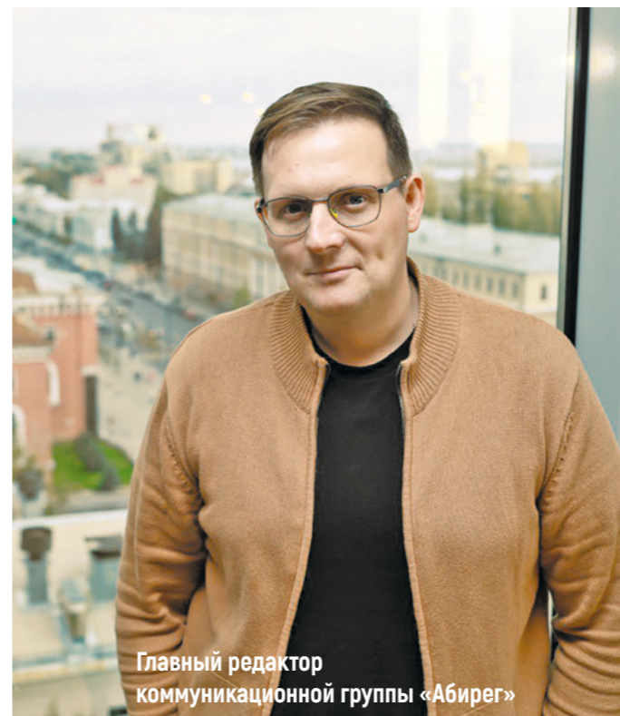
Главный редактор коммуникационной группы «Абирег»

Бизнесмен с состоянием 22,1 млрд долларов (по версии Forbes) — знаковая фигура для Липецкой области. Принадлежащий ему Новолипецкий меткомбинат стабильно возглавлял наш рейтинг крупнейших компаний Черноземья. Но только не в этом году. Компания воспользовалась дарованным правительством правом не раскрывать финансовые результаты, чтобы снизить санкционные риски. Тогда я подумал: если в Топ-100 нет НЛМК, то пусть там будет его бенефициар — так и родилась наша обложка. Идея этого текста возникла во время планерки по журналу, нам захотелось не только показать главного героя, но и рассказать о нем.